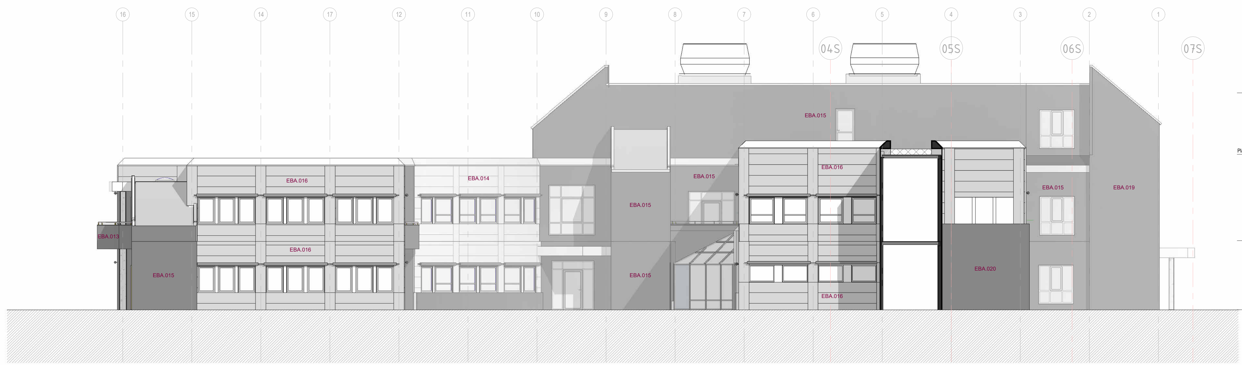
Fasade mot Sør 1 : 100