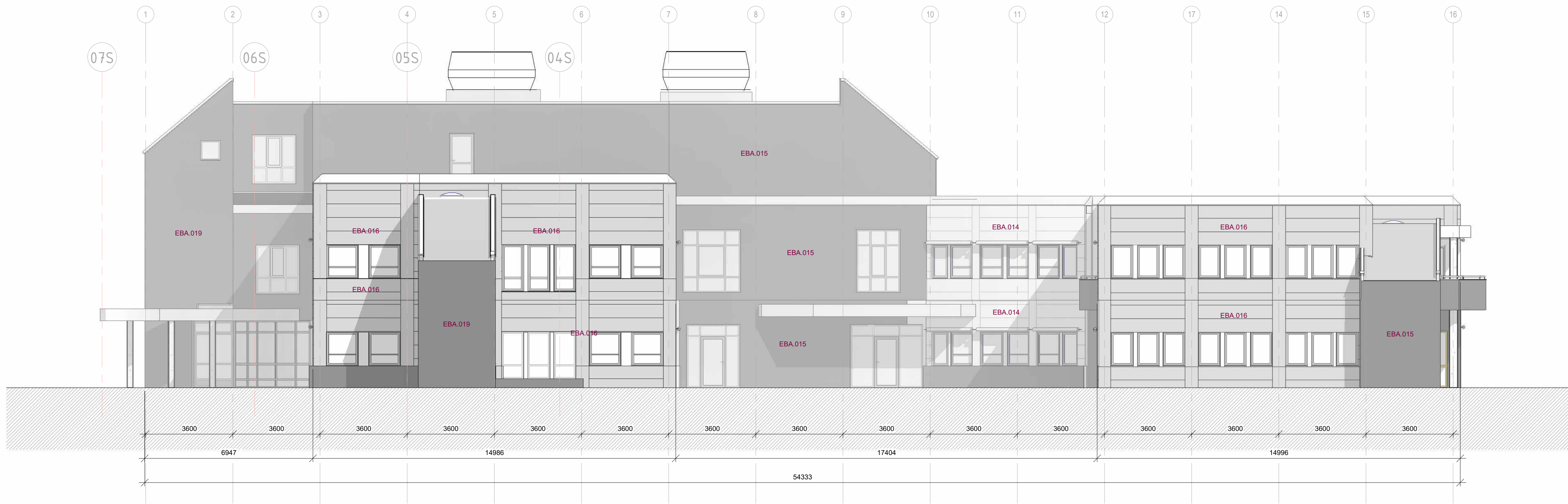
Fasade mot Nord 1 : 100